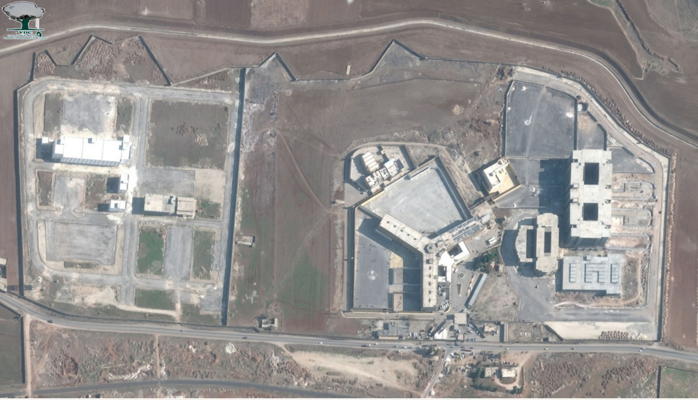
صورة مأخوذة عبر الأقمار الاصطناعية لسجن حلب المركزي قبل اندلاع الموجهات العسكرية في محيطه وتظهر فيه الأجزاء الثلاثة للسجن