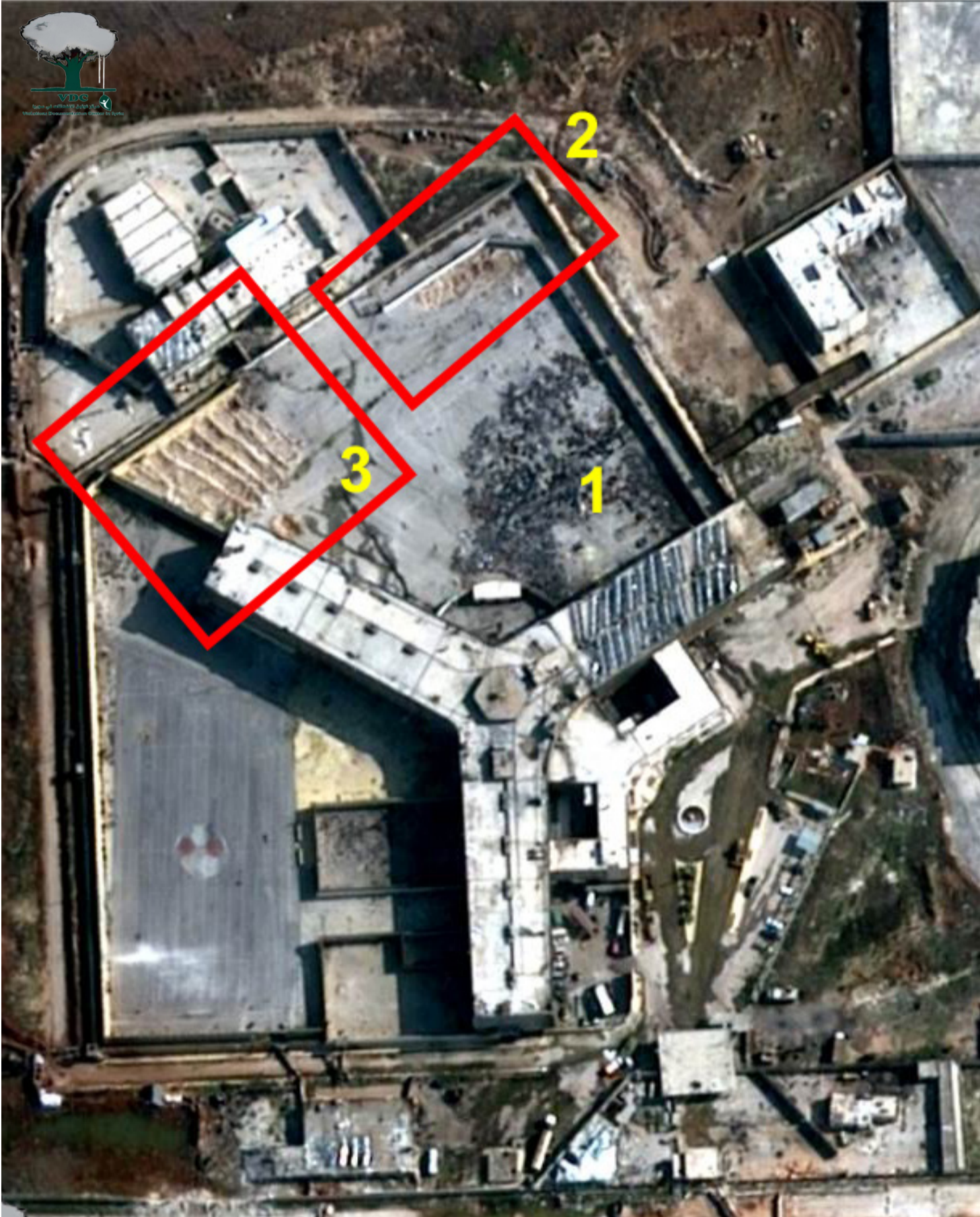
صورة بتاريخ 6 شباط 2014

ثانياً : زادت مساحة مقابر السجناء في المربع رقم ( 3 ) بشكل ملحوظ جداً واتسعت مساحتها لتبلغ حوالي 700 متر مربع، وتمّ تنظيمها، وأشارت الصورة بانسجامها بشكل كبير جداً مع كونها مقابر جماعية، والتي كان الشهود قد أكدوا مسبقاً أنّ عمليات دفن السجناء تتم في هذا المكان.