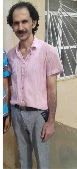
صورة بعد الافراج