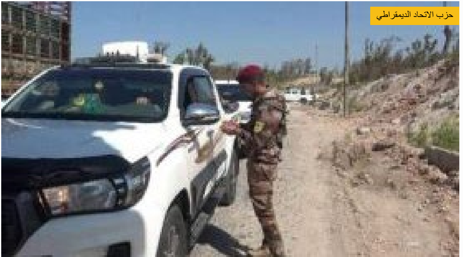
استخبارات "ب ي د" تعتقل ٨ شبان في الرقة