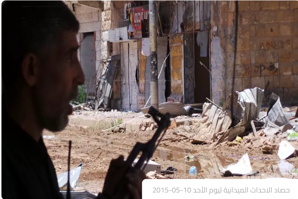
حصاد الاحداث الميدانية ليوم الأحد 2015-05-10