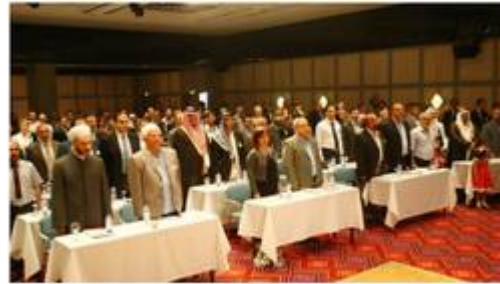
المؤتمر يعقد بمشاركة حوالي 300 معارض سوري

وتأتي حملة الضغوط الدولية تزامنا مع بدء مؤتمر المعارضة في تركيا أعماله بهدف "بحث سبل دعم الثورة السورية في الداخل وتأمين استمرارها" حسبما أجمع عليه المشاركون في المؤتمر.