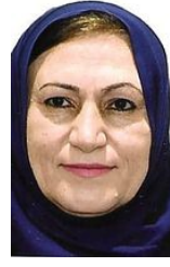
مواقف حياتية مؤثرة

نحن في المجلس الثوري الكردي السوري -كوملة- نناشد العقلاء الابتعاد عن اجواء الشحن العنصري القومي بين الکرد والعرب وبذل كافة الجهود في مكافحتها والوقوف بوجهها ، ونناشد القوى الكردية المسيطرة على الارض مراجعة حساباتها تجاه ابناء جلدتها ووقف ممارساتها القمعية بحقهم وانهاء استعدادها لهم ونعلن جاهزيتنا لتوحيد