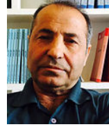
شعب العناصر الأربعة «قصة»