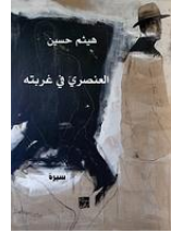
«العنصري في غربته» كتاب جديد للروائي هشام حسين