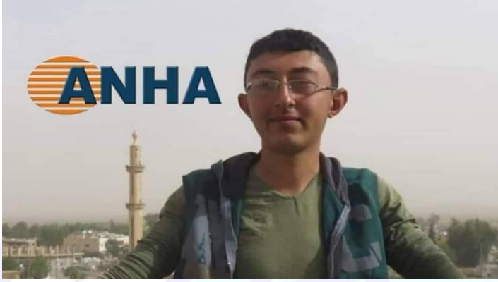
سري كانيه / رأس العين 2019/10/13 (قتل)