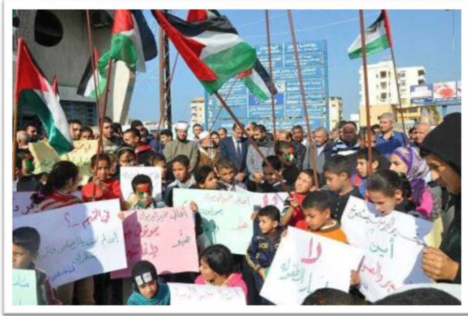
من الوقفات التضامنية مع مخيم اليرموك في لبنان