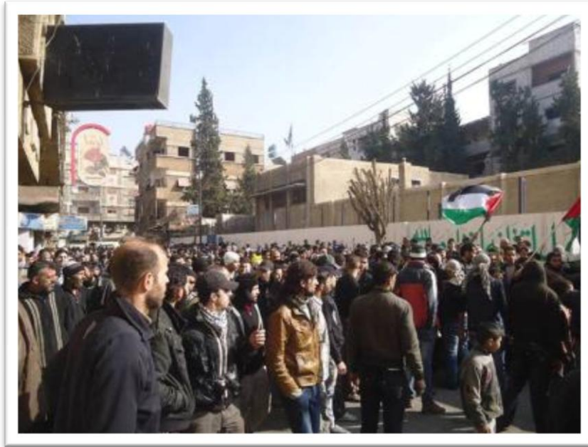
المظاهرة التي خرجت اليوم في مخيم اليرموك

نقل مراسل مجموعة العمل نبأ خروج أهالي مخيم اليرموك بمظاهرة حاشدة اتجهت نحو عدد من مقرات الكتائب المسلحة داخل مخيم اليرموك لمطالبتهم بالخروج من المخيم وجعله منطقة منزوعة السلاح، كما دعا المتظاهرون إلى فك الحصار فوراً عن المخيم وتحييده وتنفيذ بنود المبادرة التي طرحت مؤخراً لإدخال المواد الغذائية وفك الحصار عنه، وأشار مراسلنا بأن عدد من المتظاهرين قاموا بإحراق علم منظمة التحرير الفلسطينية تعبيراً عن غضب واستياء الأهالي من ممارسات المنظمة غير المجدية، إلى ذلك ما يزال أهالي المخيم يعانون من نفاد جميع المواد الغذائية والأدوية بسبب الحصار المشدد الذي يفرضه الجيش النظامي والجهة الشعبية لتحرير فلسطين القيادة العامة على مداخله ومخارجه لليوم 188 على التوالي والذي أدى إلى وفاة 53 شخصاً من أبناء المخيم جوعاً.