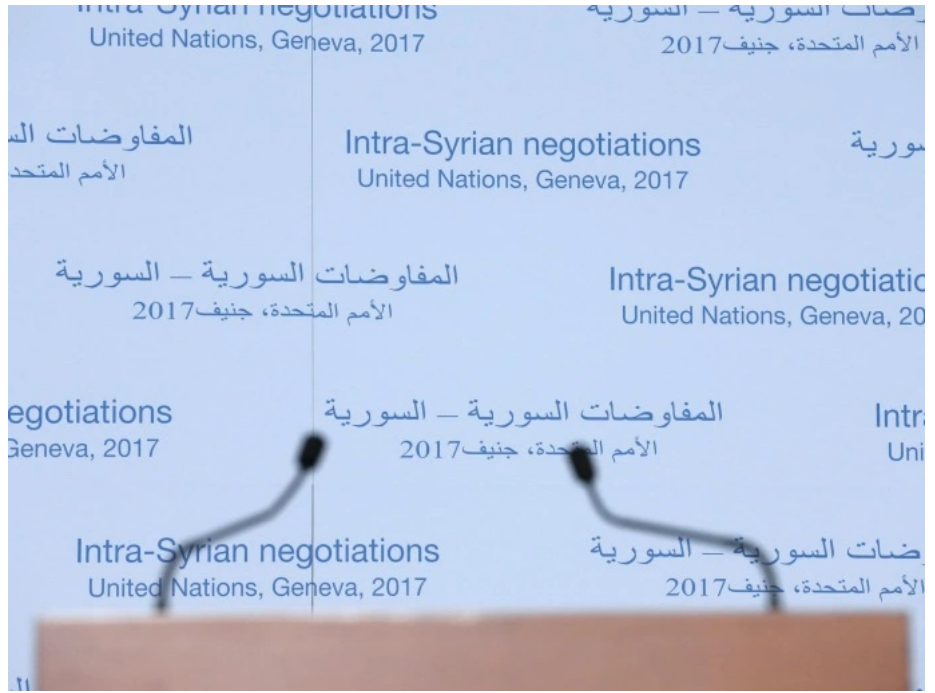
تشتت أصوات المعارضة واختلاف عناصر رؤيتها لحل الأزمة السورية يُعدّان مفاوضات جنيف 4

منسّتا "القاهرة" و"موسكو" تجمعان سوريان تم الإعلان عنهما في مصر وروسيا عام 2014، ويعلمان أنهما يمثلان طيفا من المعارضة السورية، إلا أن بعض أطراف المعارضة الأخرى ترى أنهما تحاييان روسيا ونظام بشار الأسد وتملكان توجهات وأولويات تتباين مع أولويات الهيئة العليا للمفاوضات التي يشكل الائتلاف السوري لقوى الثورة والمعارضة العمود الفقري لها.