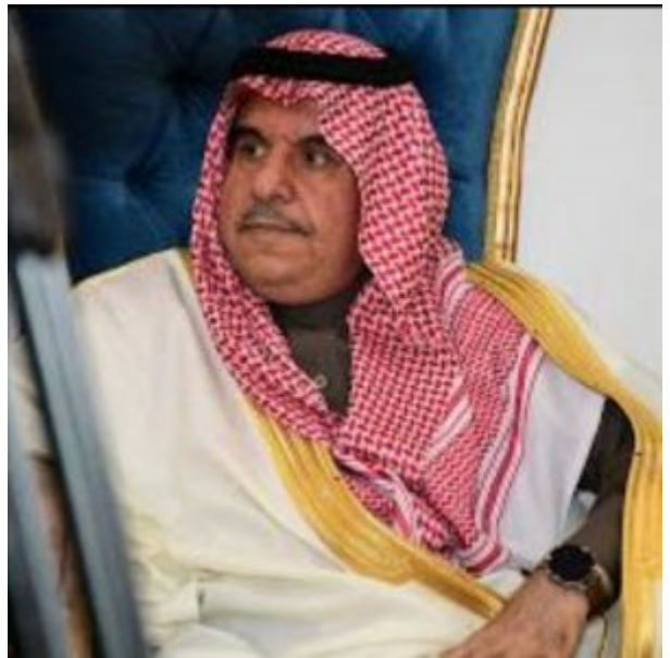
فيصل الحسن الصباح