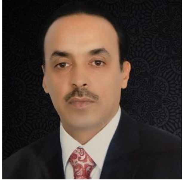
الأستاذ القاضي جمعة الدبيس العنزي

فيما يأتي أسماء بعض الأعضاء للهيئة السياسية مرتبةً حسب حروف الهجاء، وتمّ التّغاضي عن ذكر أسماء كثيرةٍ لظروفٍ تتعلّق بأمنهم وسلامتهم: