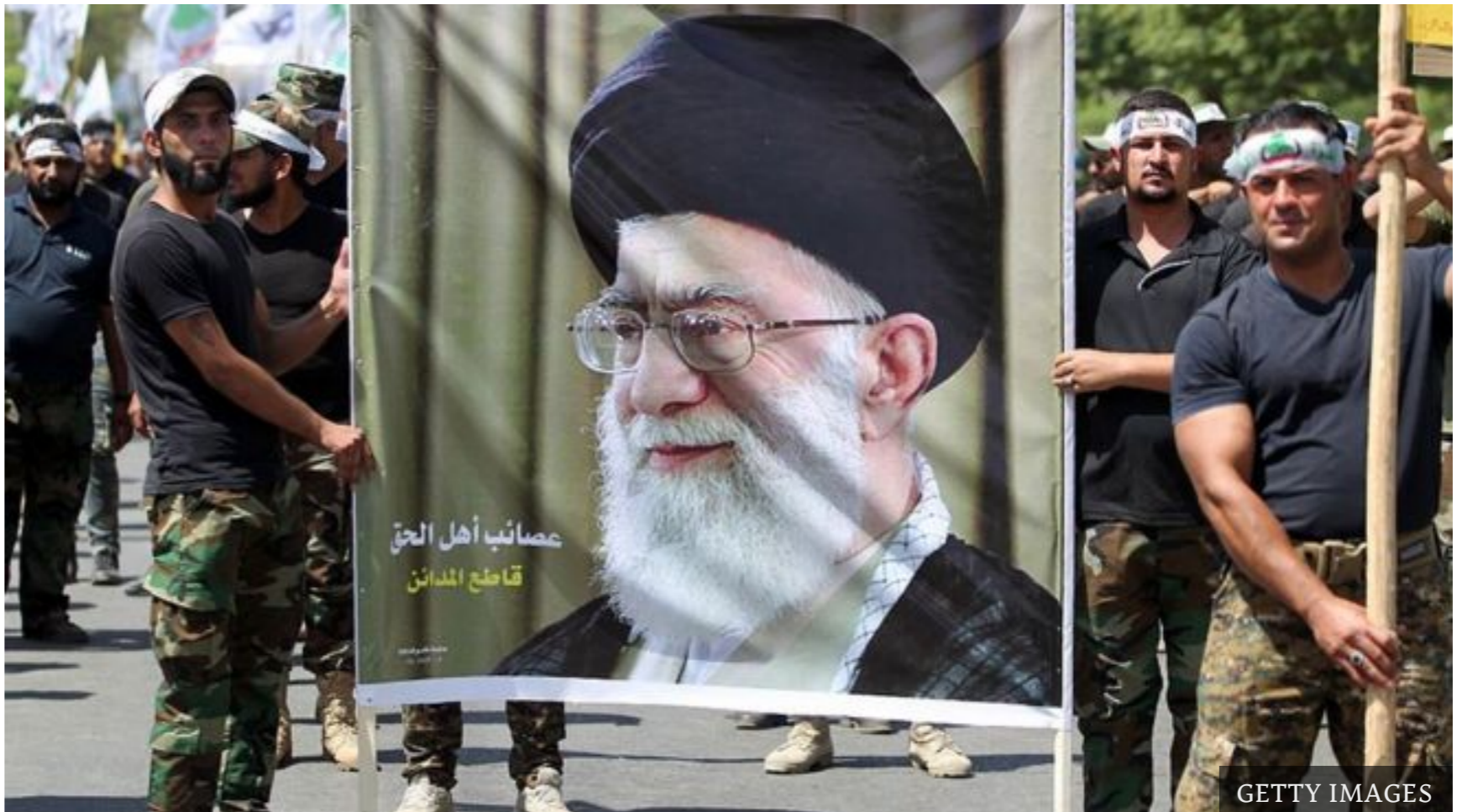
عشرات الفصائل المسلحة في سوريا والعراق موالية لإيران

تأسس الحرس الثوري الإيراني في أعقاب الثورة الإيرانية عام 1979، بقرار من المرشد الأعلى للثورة الإسلامية وقتها، الإمام الخميني، وذلك بهدف حماية النظام الناشئ، وخلق نوع من توازن القوى مع القوات المسلحة النظامية.