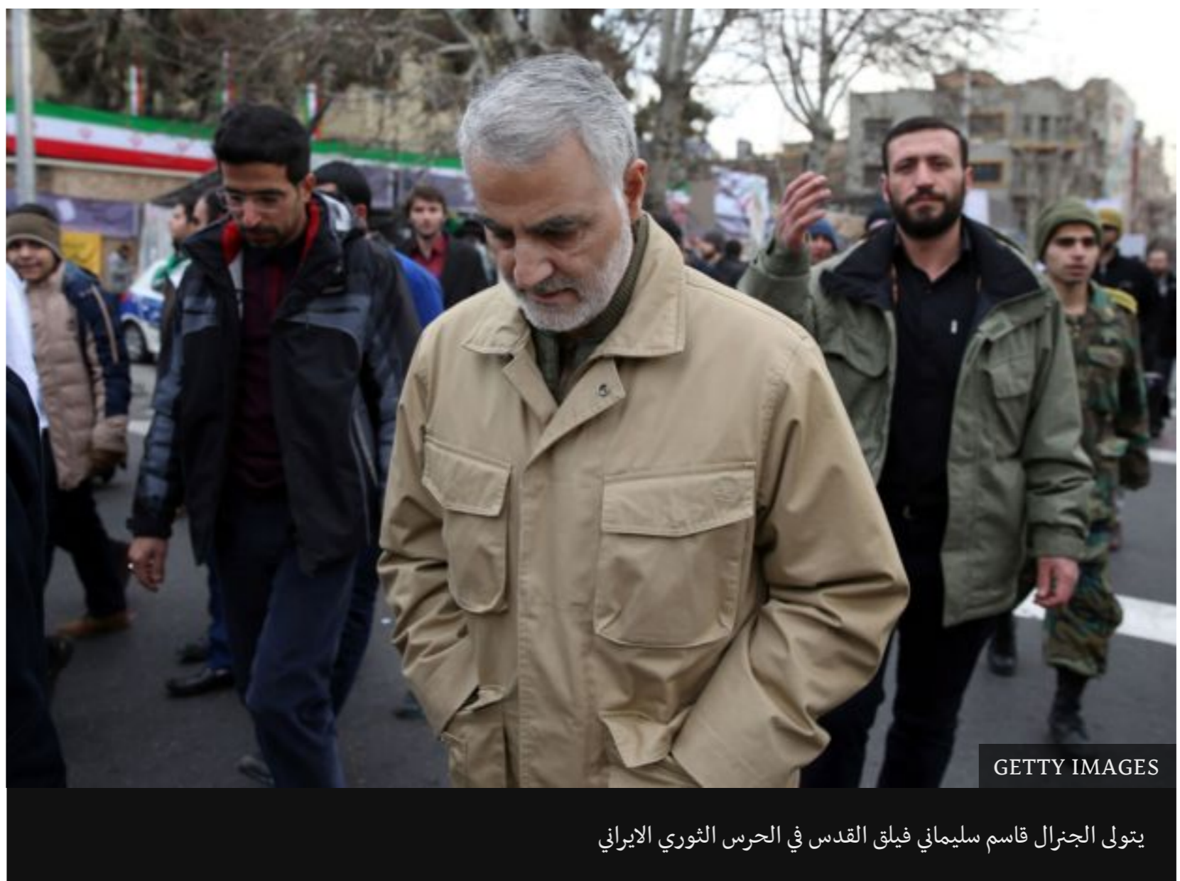
يتولى الجنرال قاسم سليمان فيلق القدس في الحرس الثوري الإيراني

ومن أولى مهام البيسج التصدي للأنشطة المناهضة للنظام داخل البلاد كما حدث عام 2009 عندما نشبت اضطرابات بعد الإعلان عن فوز محمود أحمددي نجاد في الانتخابات الرئاسية. فتصدى عناصر البيسج للمظاهرات المؤيدة للمرشح الآخر ميرحسين موسوي وقمعوها بكل عنف، ودخلت قوات البيسج سكن الطلبة في الجامعات واعتدت عليهم بالضرب. كما يتولى البيسج مهمة حفظ النظام داخل البلاد والحفاظ على القاعدة الشعبية له.