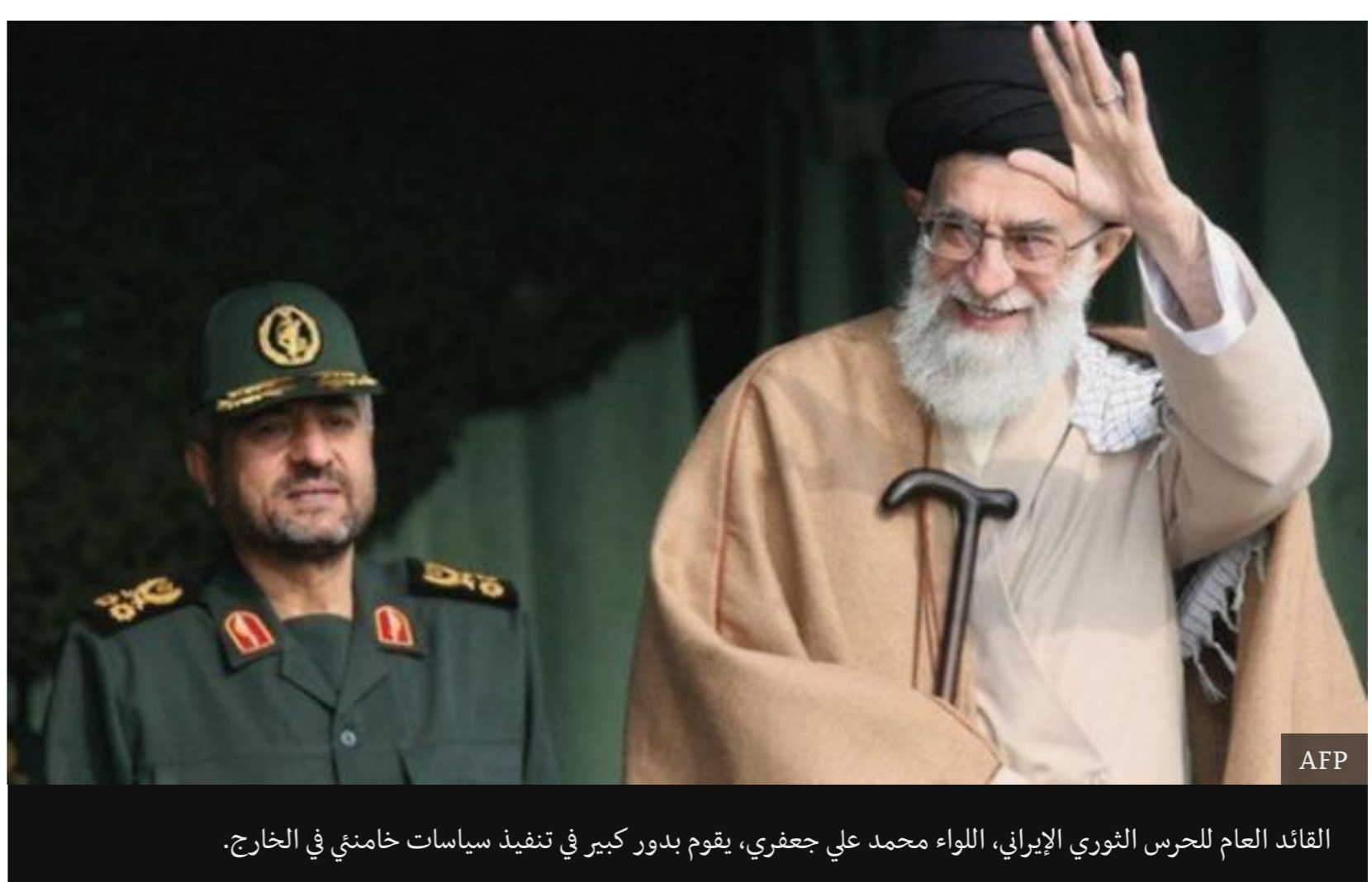
القائد العام للحرس الثوري الإيراني، اللواء محمد علي جعفري، يقوم بدور كبير في تنفيذ سياسات خامنئي في الخارج.

فقد أعلن جعفري في أعقاب دمج قوات "البيسج" (المتطوعين) بالحرس الثوري أن الاستراتيجية الجديدة للحرس الثوري تم تعديلها بناء على توجيهات المرشد الأعلى وأن "المهمة الرئيسية للحرس الثوري الآن هي التصدي لتهديدات أعداء الداخل أولا، ومساعدة الجيش لمواجهة التهديدات الخارجية".