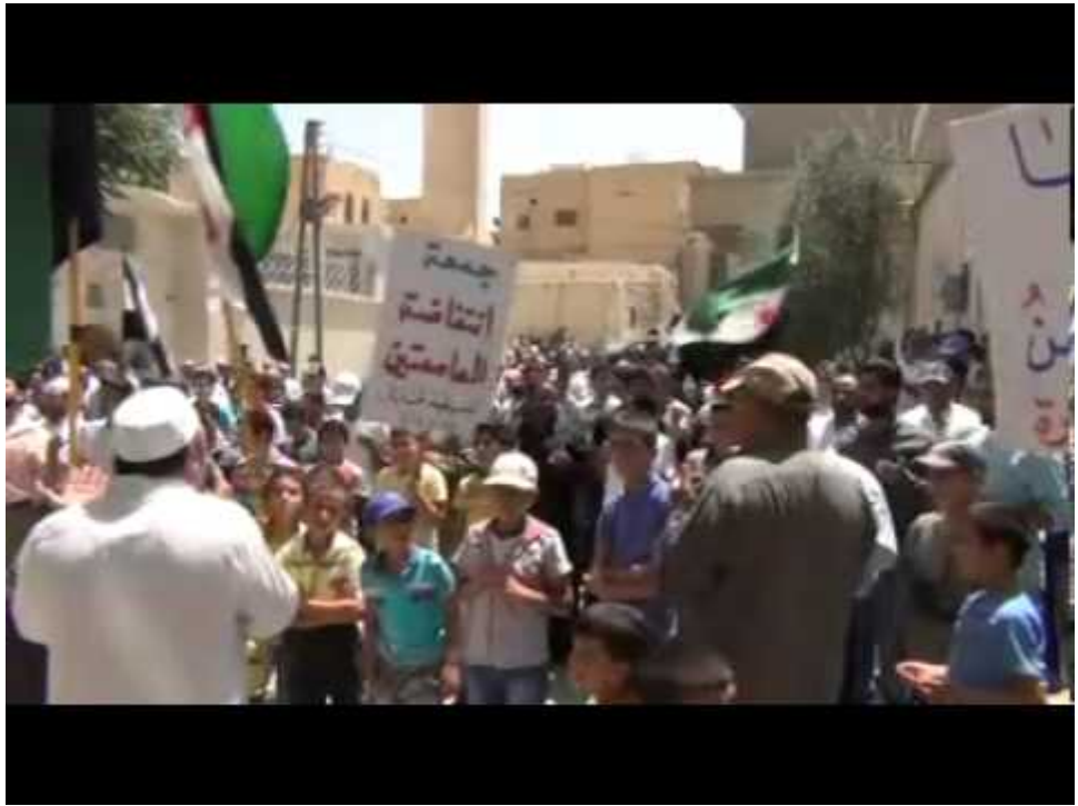
Watch Video At: https://youtu.be/YlvzmFYzbT4