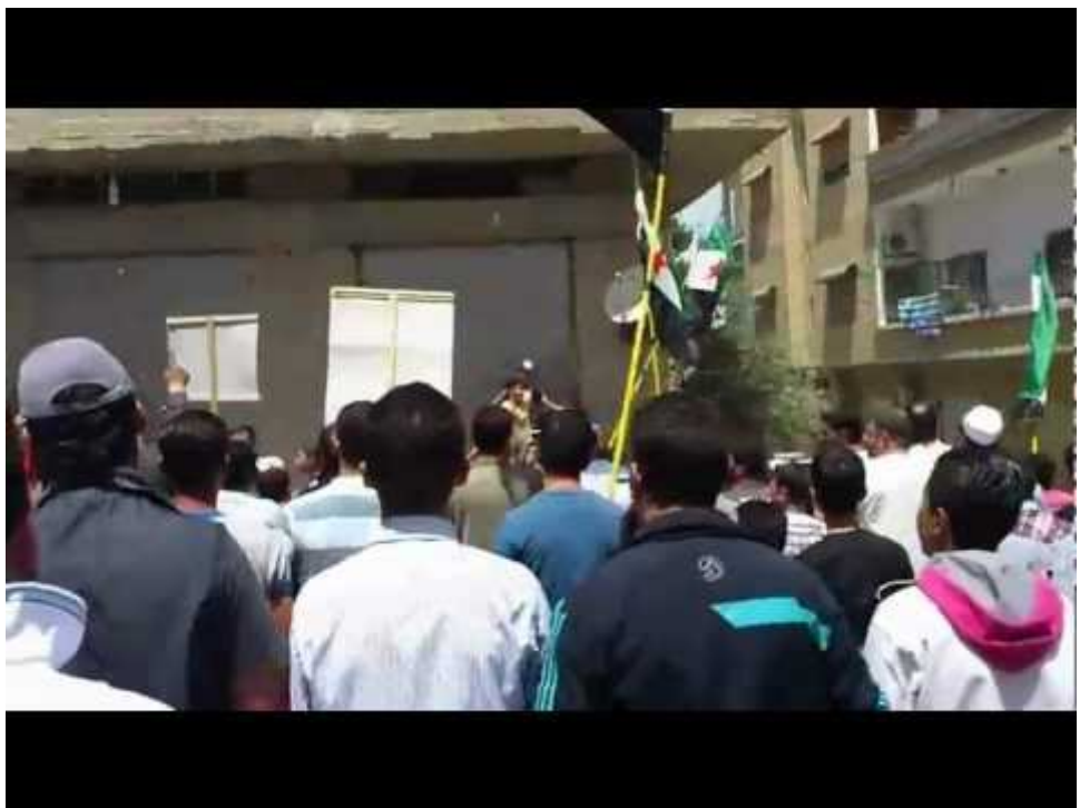
Watch Video At: https://youtu.be/MOp-j4RFbJM