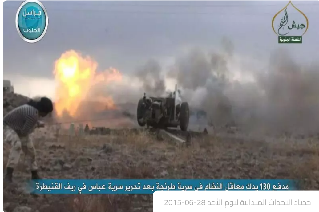
مدفع 130 يدك معاقل النظام في سرية طرنجة بعد تحرير سرية عباس في ريف القنيطرة

حصاد الاحداث الميدانية ليوم الأحد 2015-06-28