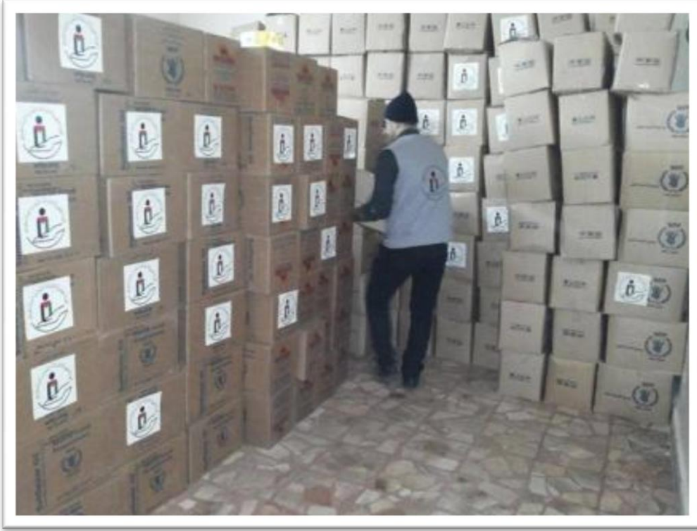
مساعدات الهلال الأحمر العربي السوري