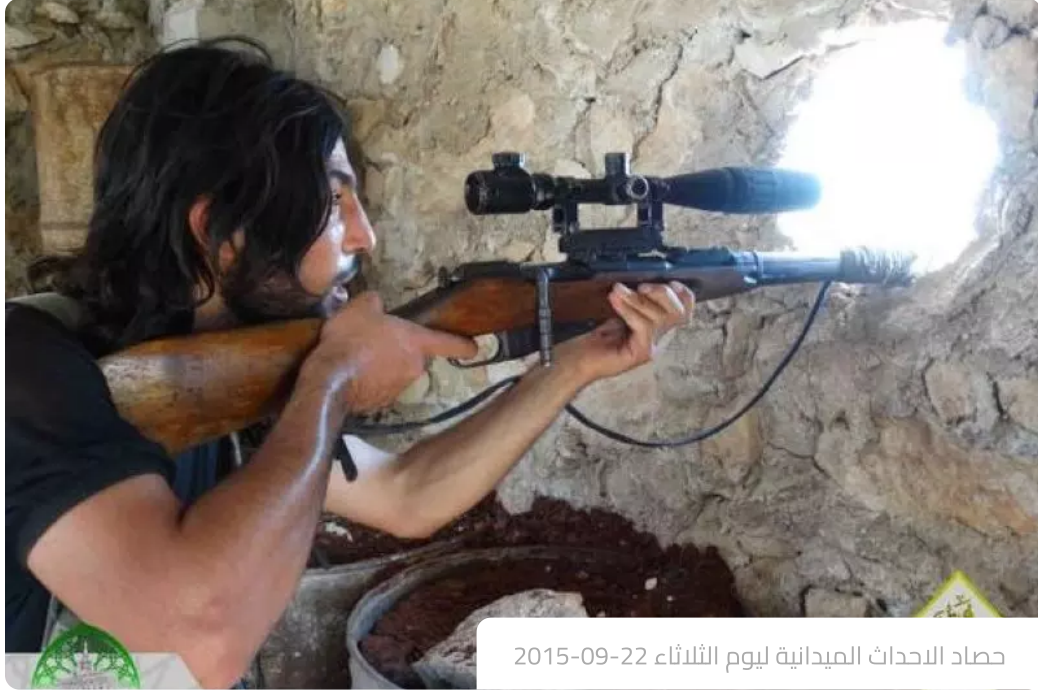
حصاد الاحداث الميدانية ليوم الثلاثاء 2015-09-22