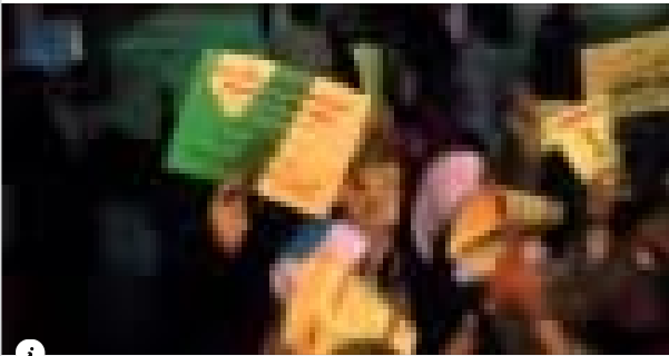
YOUTUBE.COM حمص القصور 19/9/2011 اثنتين الغضب للشهيدة زينب ج2