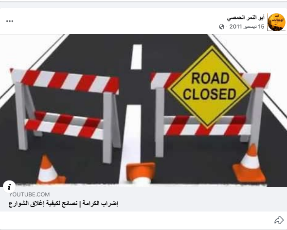
اضراب الكرامة | نصائح لكيفية إغلاق الشوارع

أبو النمر الحمصي 15 ديسمبر 2011 ان التزام بعض المناطق بالاضراب الشامل وعدم التدرج وصولا الي العصيان فهو يدل على ظاهرتين هما التزام المطلق والسرعة والثبات في وعي الشارع بالفرق ما بين العصيان والاضراب لتلم من الضروري التشديد على الفرق بينهم وما يعنيه التدرج في مراحل العصيان من تجمعة افضل بسبب التصعيد المتوازن بين جميع المناطق والشرائع فعليا شرح ما هو العصيان وما يفتخا منه وليس فقط شرح جدوله الزممي وكان كل الناس تدري ما هو وكيف يكون ولما يكون ما هي المحال المتزامنة بالعصيان ومشي نتفح ومشي تغلق او اي اجراء من اجراءات العصيان على ان تحول ان يكون هذا الشرح قبل فترة كافية لان تنتشر بين الناس في الشارع وعاشت سورية حرة ابية