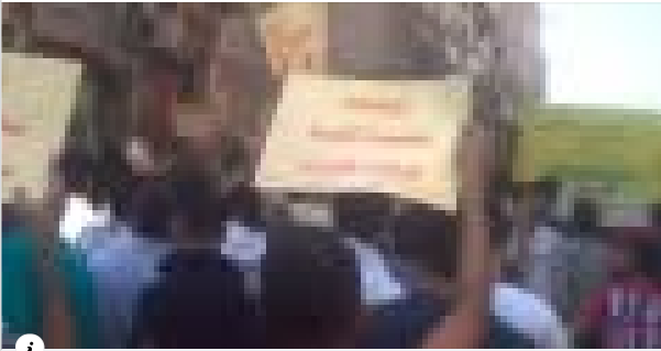
YOUTUBE.COM حمص الديلان مظاہرات الاحرار في اثنتين الغضب لأجل زينب 19 9