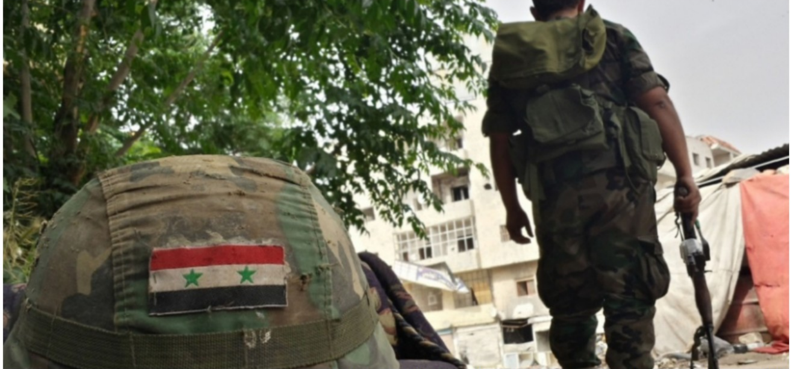
مقاتلون في نظام الأسد يسعون للاستقلال عن الميليشيات الأجنبية التي منحها النظام صلاحيات واسعة في سورية