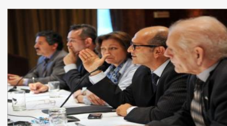
معارضة سوريا: واشنطن تريد بقاء البعث