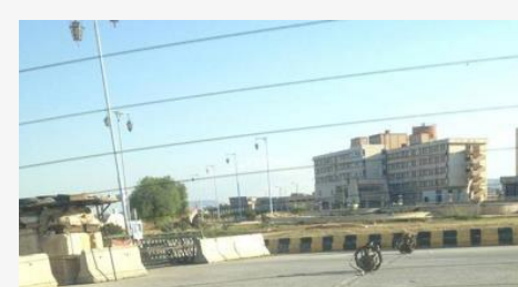
المخبرون.. أذرع النظام الطويلة في حماة