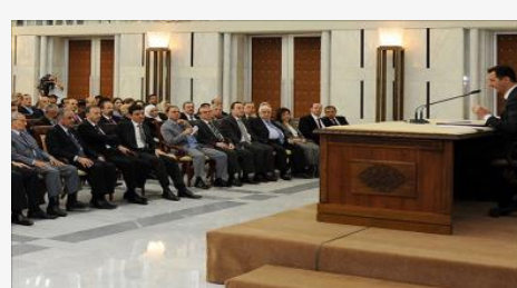
البعث يحدد قيادته ويستبعد الشرع