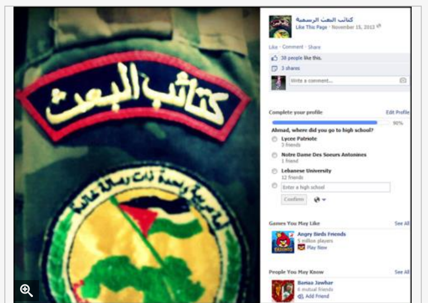
شعار "كتائب البعث" من صفحتهم الرسمية على موقع فيسبوك

هجمات أرامكو.. هل يلجأ ترامب إلى "الرمادي"؟