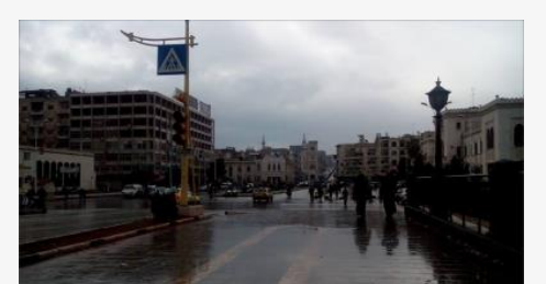
حماة مدينة أشباح في الليل