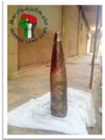
إحدى القذائف التي سقطت على مخيم اليرموك دون أن تنفجر