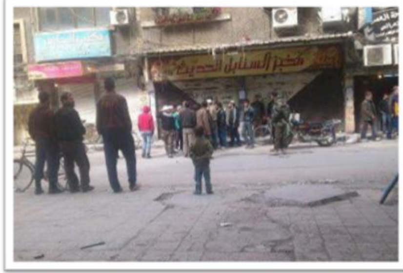
تصدي الأهالي لمحاولة نهب فرن السنابل في آخر شارع المدارس

ونوه المراسل بأن اشتباكات عنيفة جرت في ساعات الظهر بين مجموعات الجيش الحر والجيش النظامي دارت رحاها عند مبنى بلدية اليرموك وأطراف شارع نسرين، وامتدت إلى أول المخيم في محيط قسم اليرموك وأول شارع الثلاثين استخدمت فيها الأسلحة الخفيفة والمتوسطة، كما وردت أنباء لمجموعة العمل بقيام بعض العناصر التابعة لـ لواء أبابيل حوران بمحاولة نهب فرن السنابل في آخر شارع المدارس ولكن الأهالي تصدوا لهم ومنعوه من ذلك.