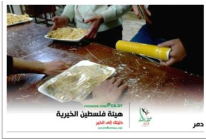
توزيع الوجبات الغذائية على العائلات النازحة في منطقة دمر

ضمن برنامجها الإغاثي هيئة فلسطين الخيرية وبالتعاون مع جمعية الشباب الخيرية قامت بتوزيع وجبات غذائية على العائلات النازحة من مخيم اليرموك والمخيمات الأخرى في منطقة دمر.