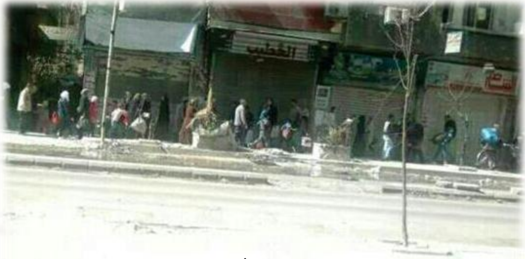
"حركة دخول وخروج أهالي مخيم اليرموك"

"أربعة شهداء فلسطينيين في سورية بينهم طفل استشهد بسبب الحصار الذي يفرضه الجيش النظامي على مخيم اليرموك"