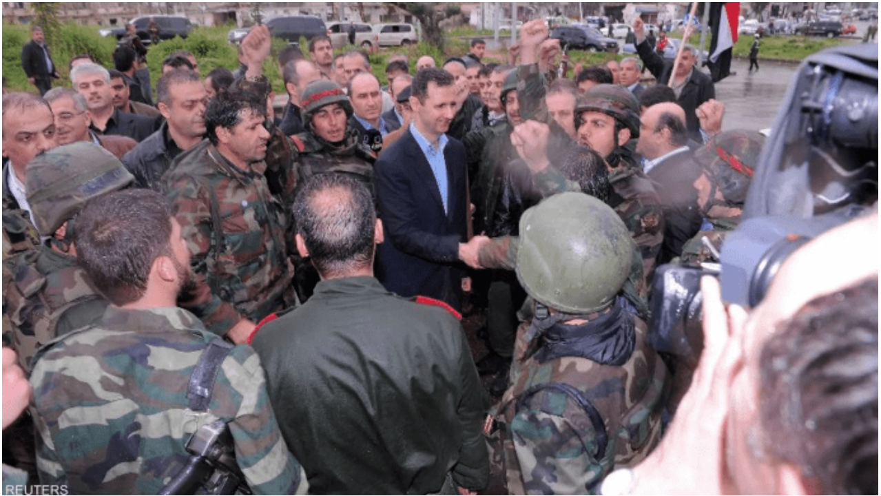
"بشار الأسد" في حي بابا عمرو - 28 آذار 2012

بعد زيارة بشار الأسد إلى حي بابا عمرو ، في 27 آذار 2012، أقسم الثوّار أن يعيدوا تحريره في التاريخ ذاته، وبدأ التخطيط للعودة إليه عقب الانسحاب منه، في 2 آذار 2013، وبالفعل مكث الثوار فيه لمدة أسبوعين واضطروا للانسحاب مجدّداً بعد كثافة القصف الجوّي والبرّي.