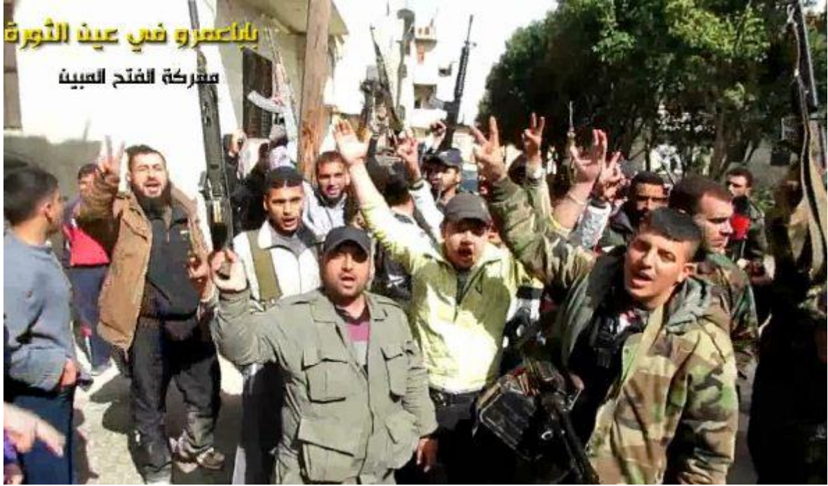
الثوار يدخلون حي بابا عمرو - 10 آذار 2013

ويتابع "النهار"، أنه في بداية الشهر الثاني من عام 2013 "تقدّم جيش النظام باتجاهنا من جميع المحاور، قاومنا لنحو شهر ثم انسحبنا إلى منطقة تل الشور، كانت لدينا عيون داخل بابا عمرو وأخبرونا بتخفيف حواجز النظام فيه وتوجههم إلى أحياء حمص المحاصرة، وكنا على تنسيق مع ثوار حي الوعر، وحددنا توقيتاً يتزامن مع دخول بشار الأسد قبل عام إلى بابا عمرو، وتم الدخول في العاشر من آذار 2013 وحملت المعركة اسم (الفتح المبين)".