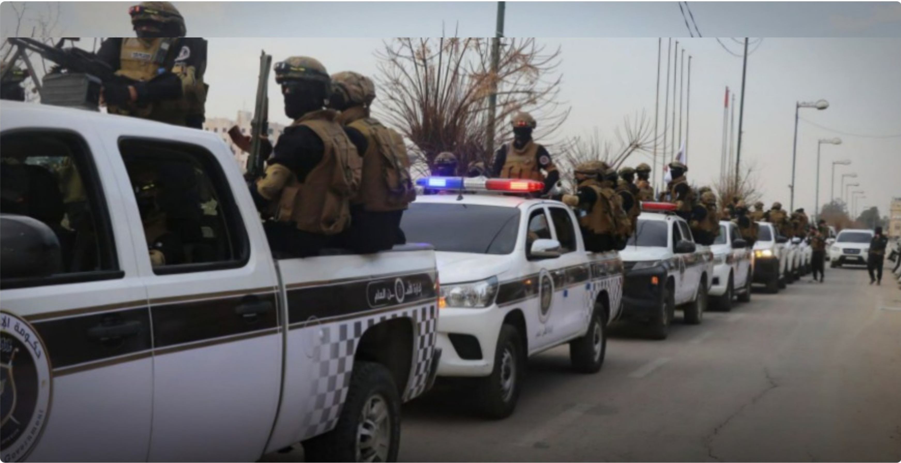
صورة أرشيفية - وزارة الداخلية