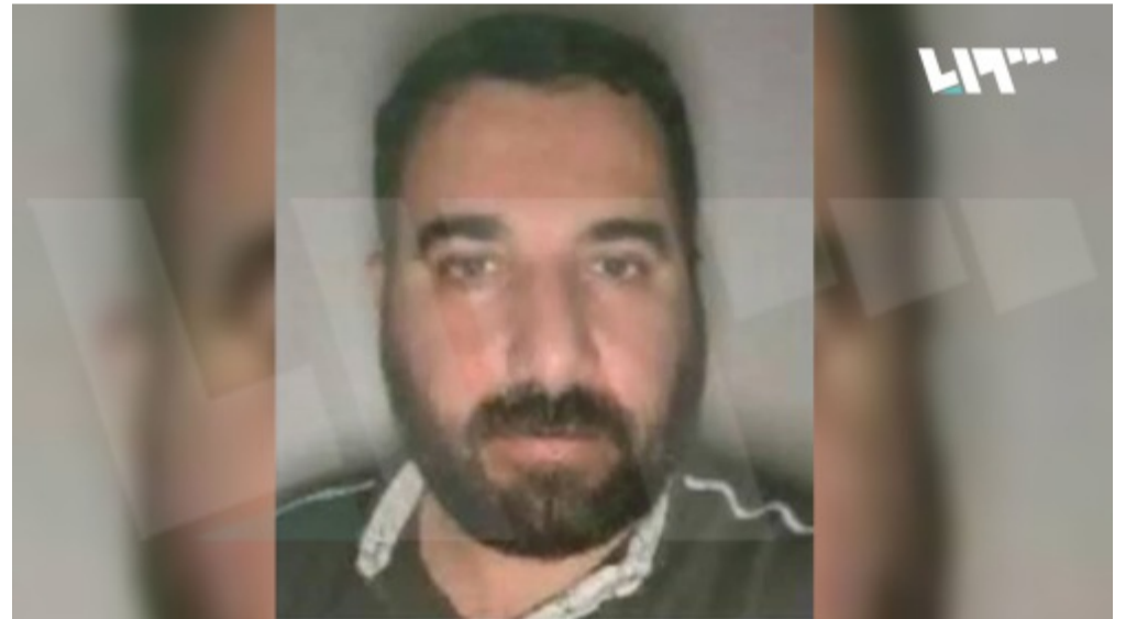
صورة المدعو عبدالرحمن العريقي "أبو الحسن الهاشمي القرشي"

وأصدرت القيادة المركزية الأمريكية حينها بياناً أعلنت فيه مقتل "أبو الحسن الهاشمي القرشي" زعيم تنظيم "الدولة الإسلامية" على يد الجيش السوري الحر في درعا.