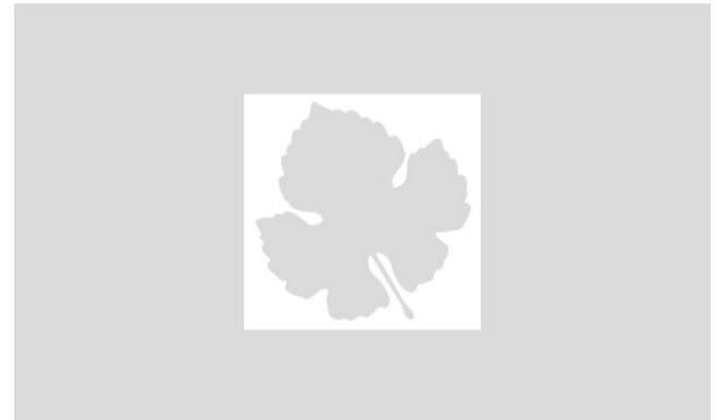
روسيا تسلم الأمم المتحدة وثائق حول الكيماوي السوري «تدين المعارضة»

تابعنا على : تويتر. تلغرام. النشرة البريدية