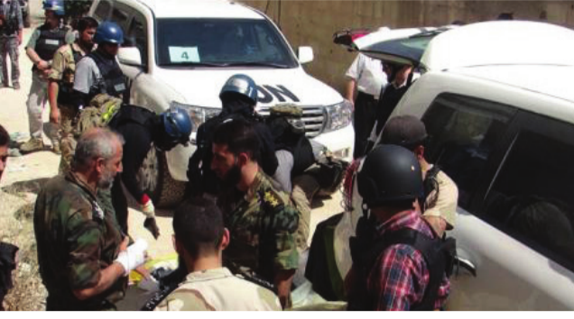
محققو الأمم المتحدة حول استخدام الكيماوي يغادرون دمشق... وتقريرهم قد يستغرق أسبوعين