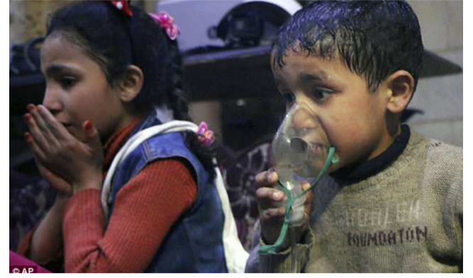
"حظر الأسلحة" لديها "أسباب معقولة للاعتقاد" باستخدام الكيماوي في قصف مارع 2015