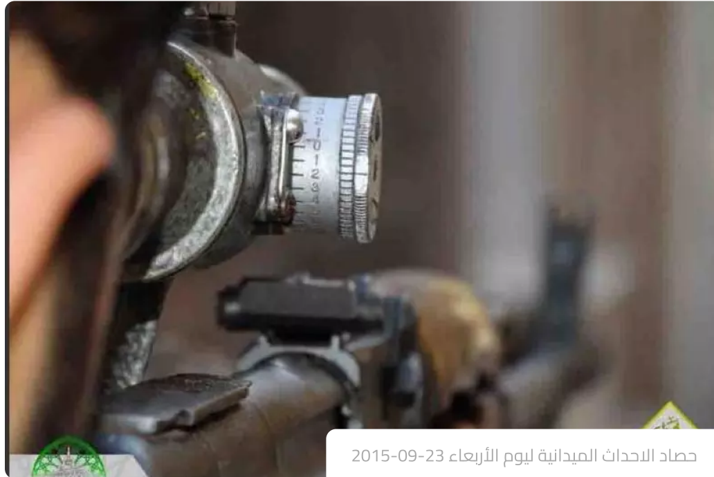
حصاد الاحداث الميدانية ليوم الأربعاء 2015-09-23