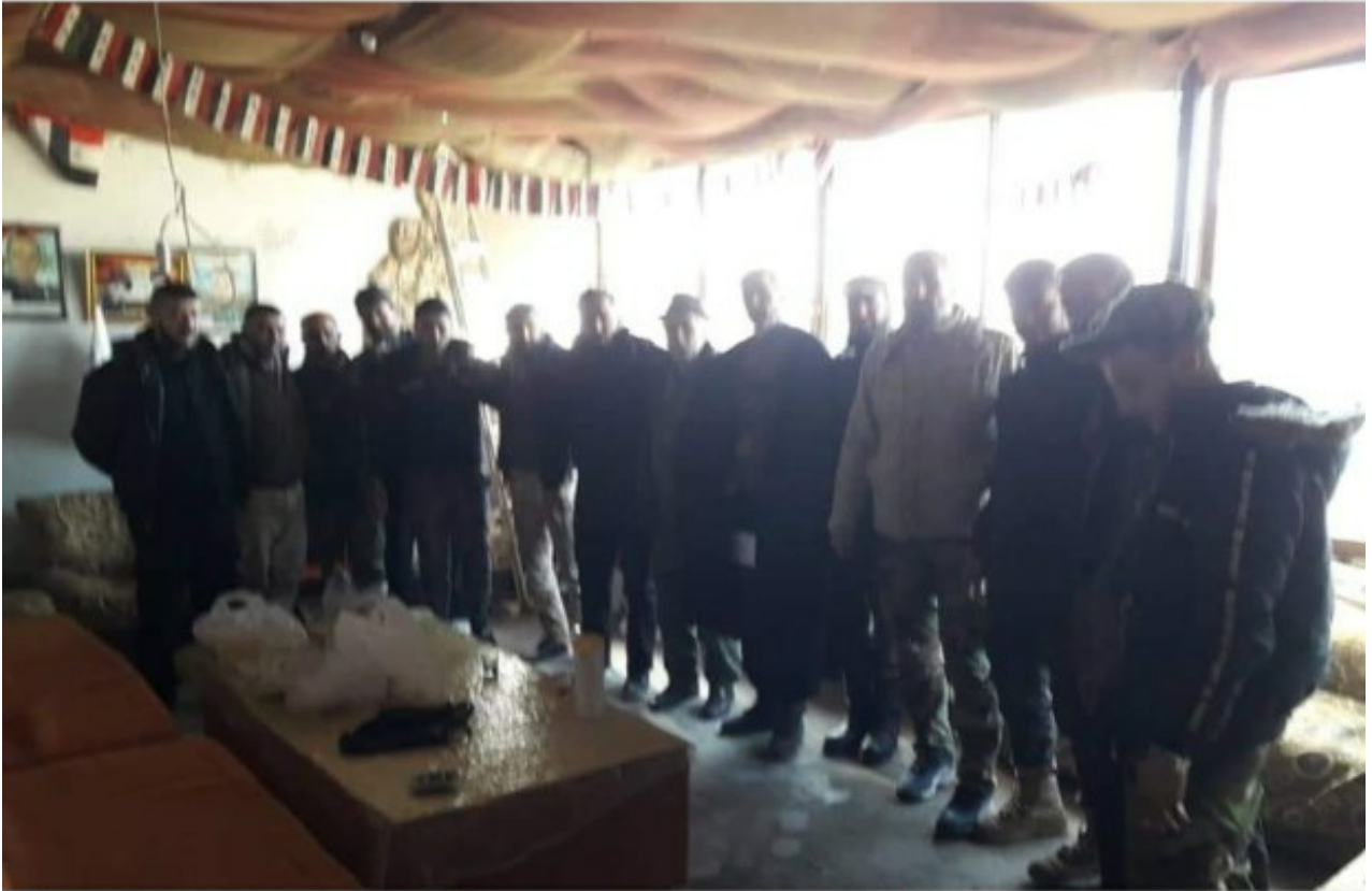
منشورات للحزب أثناء إرسال إحدى الميليشيات لمساندة قوات النمر المدعومة من روسيا