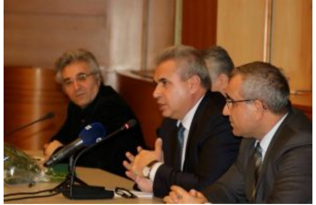
إبراهيم برو، رئيس المجلس الوطني الكردي، مؤتمر في ألمانيا

حزب الإتحاد الديمقراطي بلاحق فؤاد عليكو, بناءً على اتهامات باطله