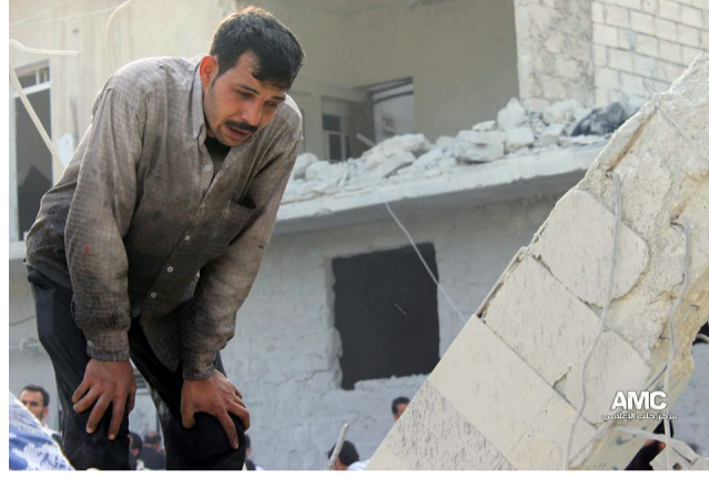
عشرات الشهداء جراء غارات عنيفة على أحياء حلب