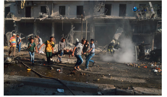
الطيران الحربي ينفذ مجزرة في حي طريق الباب بحلب

تابعنا على : تويتر تلغرام النشرة البريدية