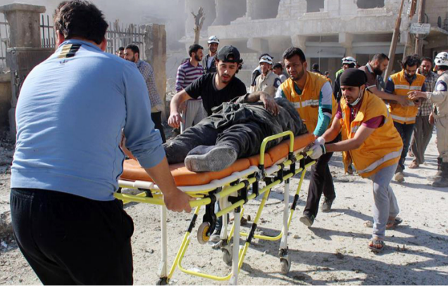
خلال يومين.. أكثر من 50 شهيدًا جراء غارات الأسد على إدلب