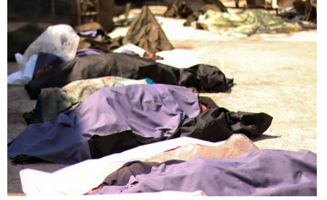
الباب.. مجزرة "سوق الهال" بتوقيع طيران الأسد