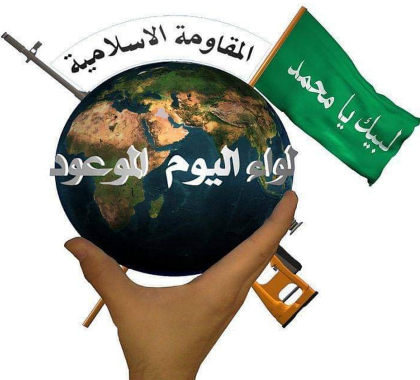
" شعار تنظيم, ( لواء اليوم الموعود ) العراقي "

شعار التنظيم هو عبارة عن شكل الأرض ومن خلفه سلاح حربي ومن أعلى جهة اليمن يوجد علم كتب عليه " لبيك يا محمد " إشارة إلى الإمام المهدي الذي يعتبر الإمام الثاني عشر لدى الشيعة ومن جهة اليسار يوجد علم كتب عليه " المقاومة الإسلامية " إشارة إلى " الإسلام ".