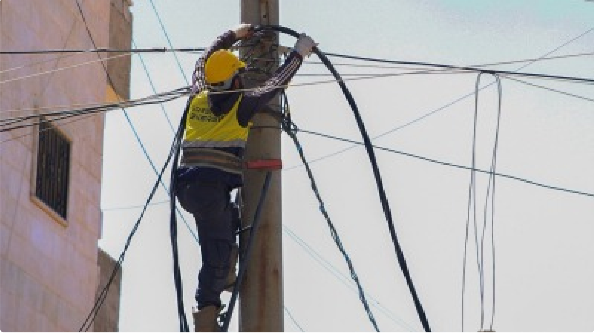
عمليات توصيل الكهرباء في بلدة دير حسان - Green Energy