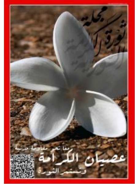
مجلة ثورة الكرامة

إذا كنت من دعاة الوحدة الوطنية فادعم عصيان الكرامة لأنه السبيل الوحيد لنتجنب حرب طاحنة بعد سقوط النظام قد تمزّقنا وتفرّقنا إلى اطراف متناحرة لكل منها ثأر لدى الآخر ودوامة عنف لا تنتهي. إذا كنت تريد الرد على فيتو روسيا وتثبت لها على أنها في الجانب الخاطئ من التاريخ، وأن الشعب السوري لن تُكسر ارادته وسنكون هي الخاسر الأكبر في وقفها ضد النظام، شارك في عصيان الكرامة لتريها حجم الثورة الحقيقي وانتشارها.