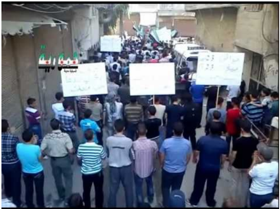
Watch Video At: https://youtu.be/Akcp-4QSOvc