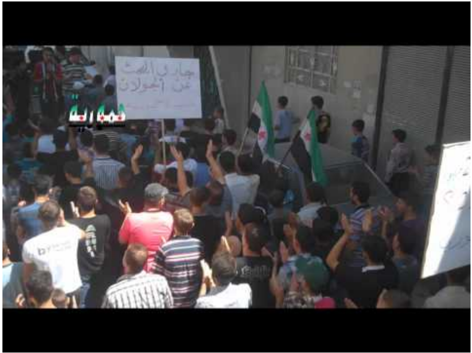
Watch Video At: https://youtu.be/yQNUeADcfmM