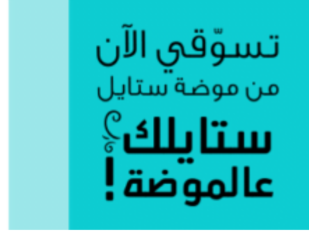
تسوّقي الآن من موضة ستايل

وجسد الطويل دور "تضال" في مسلسل "ما وراء الشمس" الذي قام ببطولته النجم بسام كوسا. كما وشارك الطويل رفقة سامر المصري في المسلسل الشهير "أبو جاتي" كسائق يعمل على سيارة أجرة. وبرع الطويل في أعمال البيئة الشامية, حيث جسد دور "أبو عذاب" في الجزء الثاني من "الدبور". كما وقدم الطويل في ذات العام دوراً هاماً "يعقوب" في مسلسل البيئة الشامية "رجال العز". وفي عام 2012 شارك الطويل في المسلسل التاريخي الضخم "عمر" مجسداً دور الصحابي الجليل "سلمان الفارسي". كما قدم الطويل في ذات العام دور مازن في المسلسل الكوميدي "أيام الدراسة".