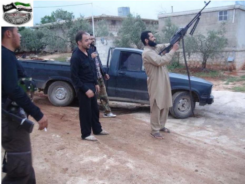
يحيى تاج الدين الحسينو القائد العسكري لفرقة سليمان المقاتلة