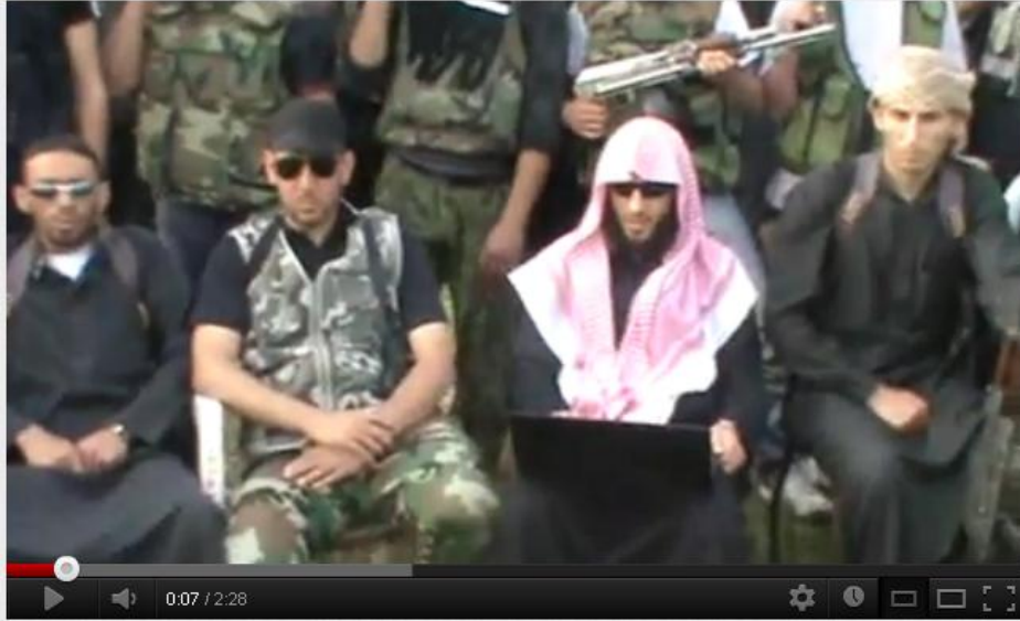
صورة من البيان الثاني لكتيبة ذي النورين

كتيبة ذي النورين بيان رقم 2 تاريخ 2012-5-11