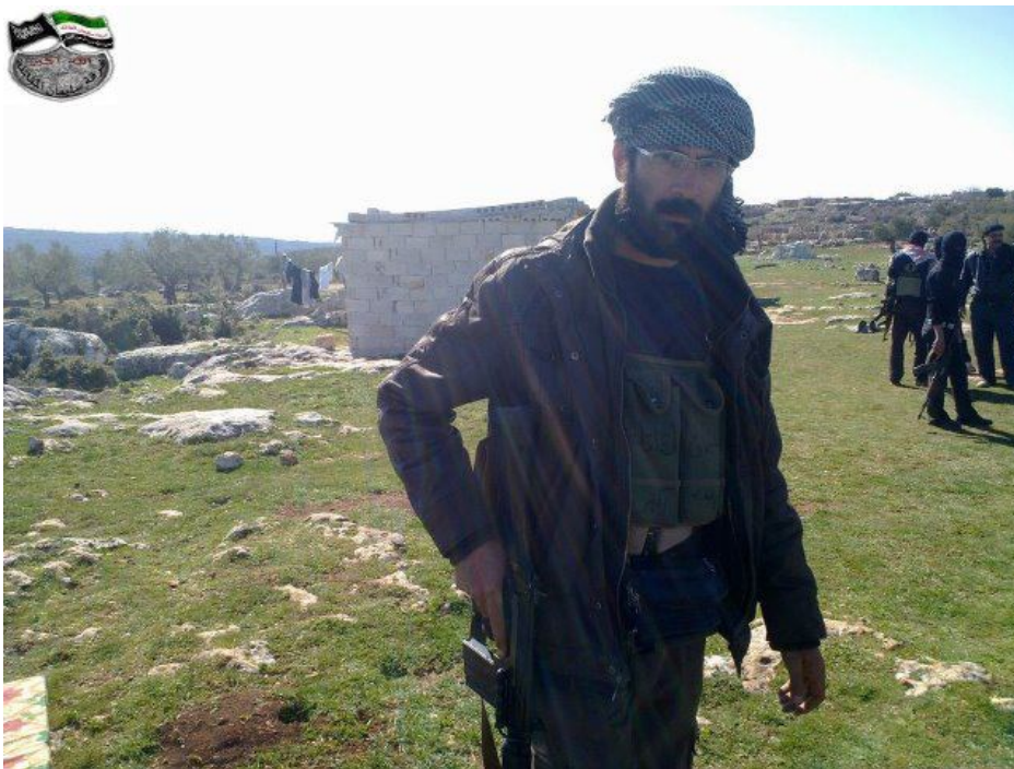
أحد قادة كتائب فرقة سليمان المقاتلة - كما يتم وصفه من الفرقة (البطل المجاهد أبا عبد الله)