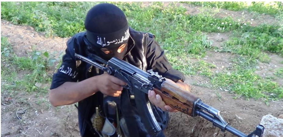
أحد مقاتلي لواء الإسلام