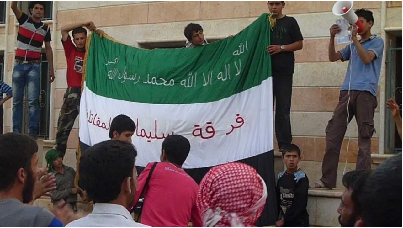
مظاهرات في قرى حارم وتحى فرقة سليمان المقاتلة 18 5 2012