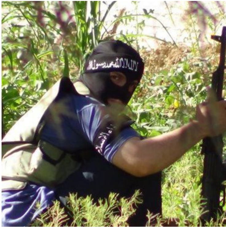
أحد مقاتلي لواء الإسلام