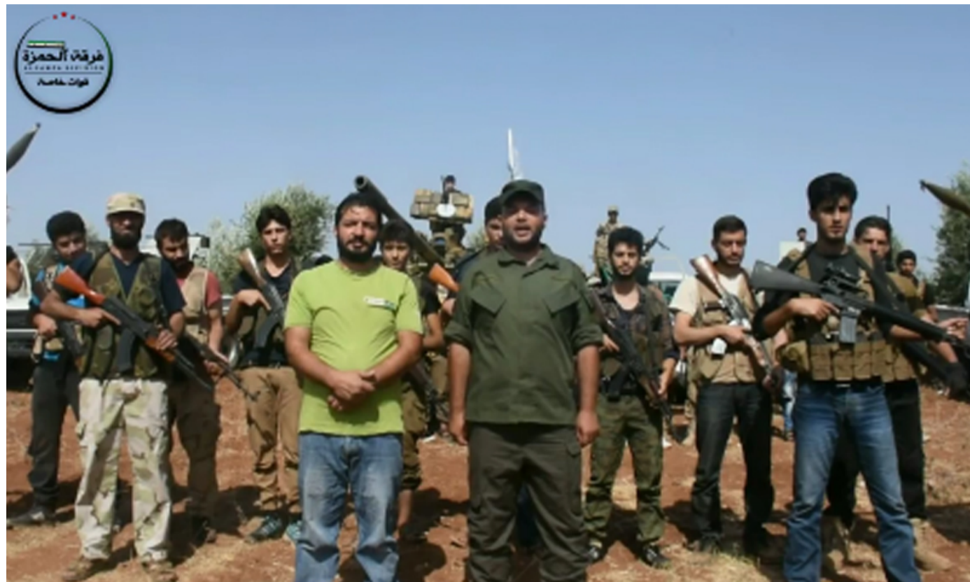
إعلان تأسيس لواء "سمرقند" في ريف حلب الشمالي- الأربعاء 22 حزيران (يونيو)