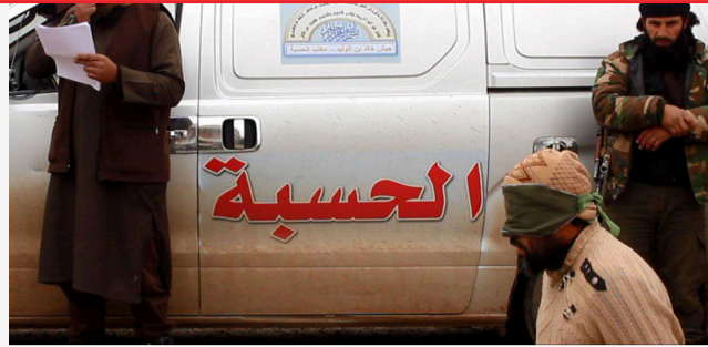
أبناء عن مقتل زعيم "جيش خالد" وقائده العسكري