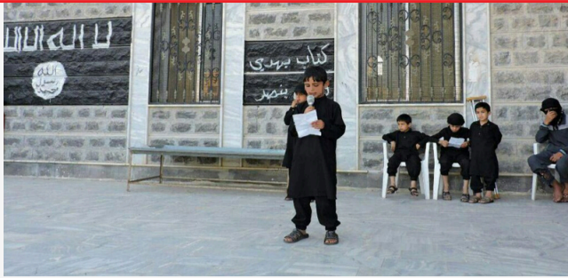
أبناء عن تسمية أمير جديد لـ "جيش خالد" بعد المقدسي القتل