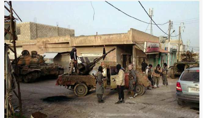
مصادر لعنبلدي.. مقاتلون في جيش خالد يعقلون قياديين بارزين فيه