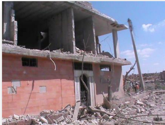
من آثار الدمار في تجمع المزيريب

تعرضت بلدة المزيريب جنوب سورية التي يقطنها نحو 8500 لاجئاً فلسطينياً للقصف بعدد من قذائف الهاون، مما أحدث دماراً وخراباً في منازل المدنيين، إلى ذلك ما تزال حالة التوتر تسود في المنطقة الجنوبية من سورية بسبب ما شهدته في الفترة من أعمال قصف واستهداف بالصواريخ والبراميل المتفجرة منذ أن أعلنت فصائل الجبهة الجنوبية في المعارضة السورية المسلحة عن إطلاق معركة عاصفة الجنوب يوم 25 / حزيران - يونيو المنصرم، بهدف السيطرة على المناطق التي لا تزال تحت سيطرة القوات الحكومية في محافظة درعا.