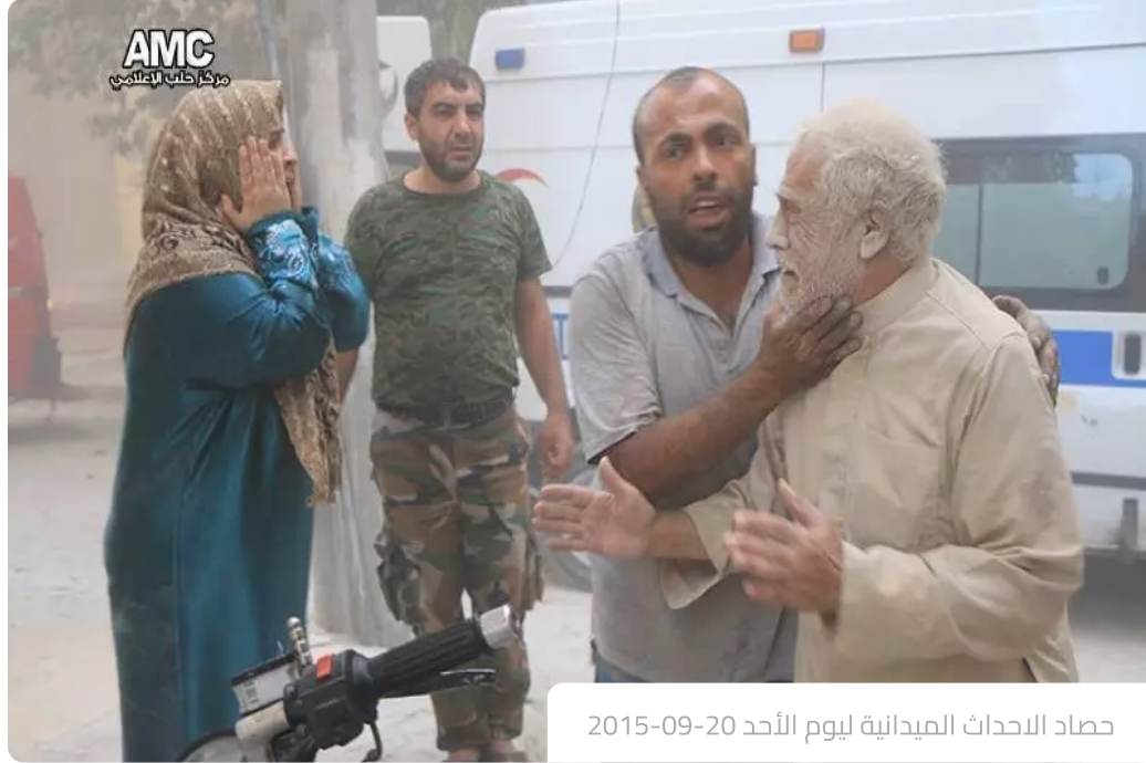
حصاد الاحداث الميدانية ليوم الأحد 20-09-2015