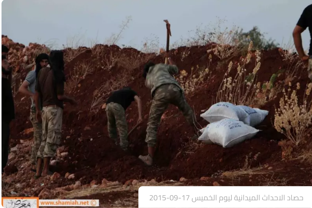
حصاد الاحداث الميدانية ليوم الخميس 2015-09-17