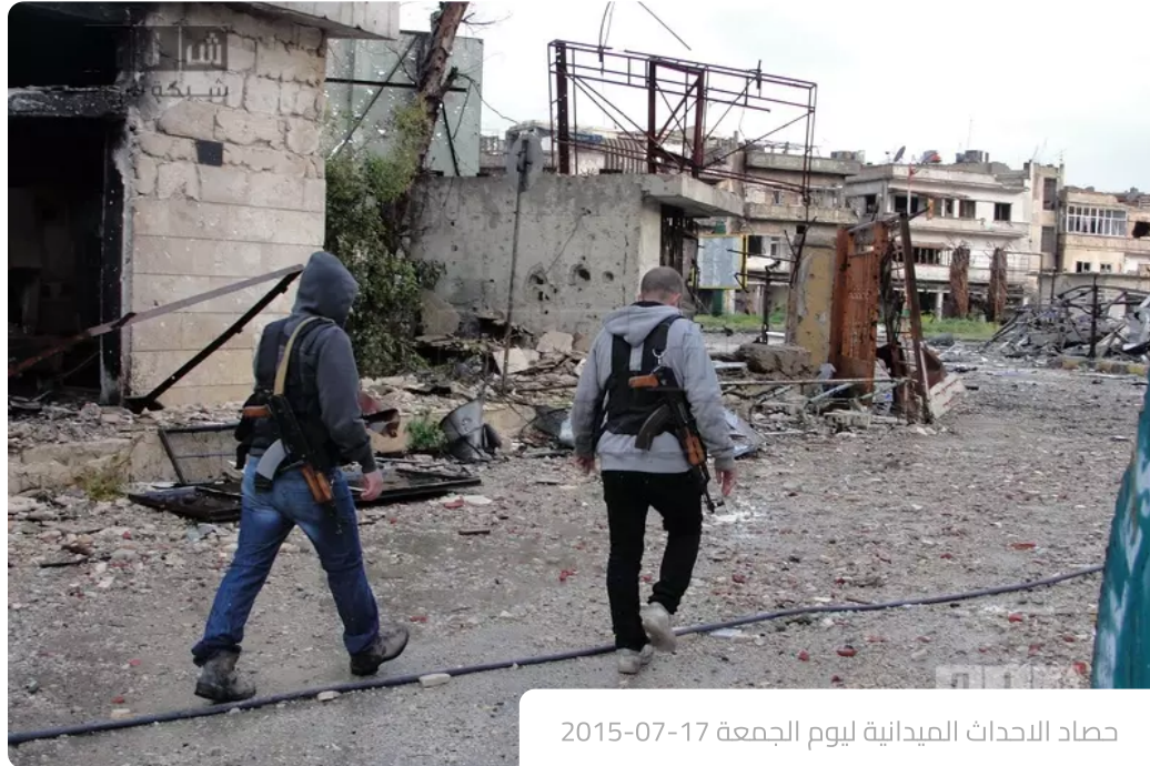
حصاد الاحداث الميدانية ليوم الجمعة 2015-07-17