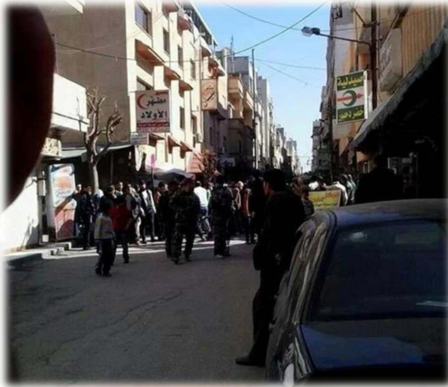
"حملة الدهم والتفتيش في مخيم العائدين بحمص"

"حملة دهم وتفتيش في مخيم العائدين بحمص، وأنباء عن اتفاق لتحييد مخيم اليرموك"