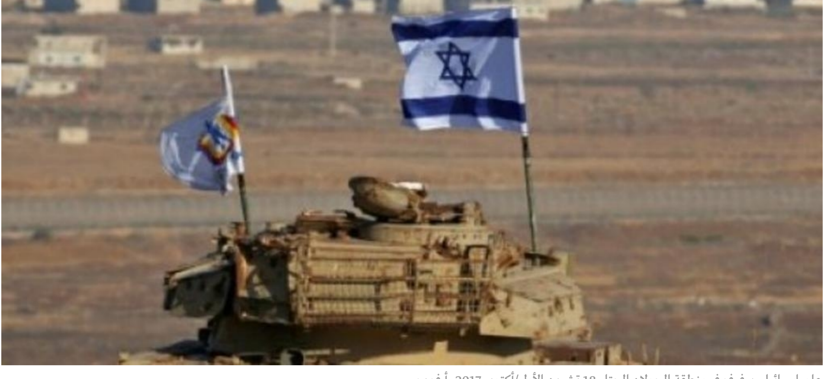
علم إسرائيلي يرفرف في منطقة الجولان المحتل 18 تشرين الأول/أكتوبر 2017.