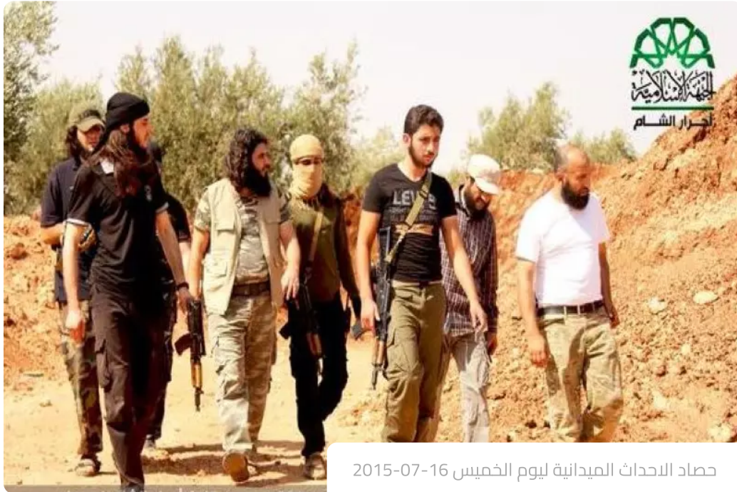
حصاد الاحداث الميدانية ليوم الخميس 2015-07-16