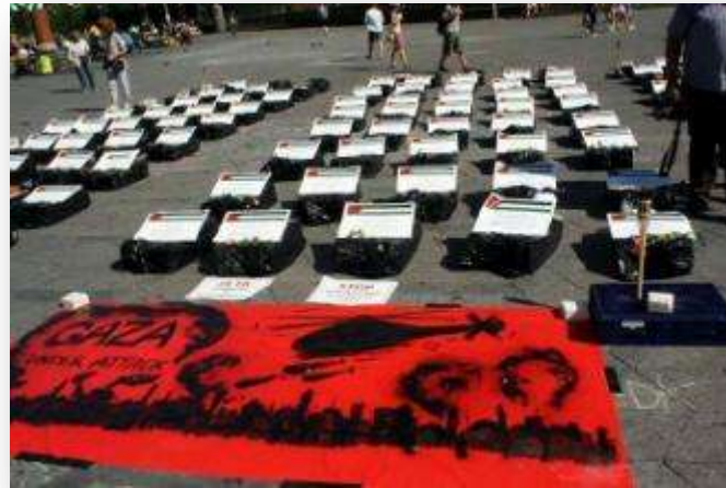
الإعتصام التضامني مع غزة في كوبنهاجن

شهدت مدينة فلنسية مظاهرة نصرية لأهل غزة دعا إليها شباب مخيم اليرموك والجالية الفلسطينية والجمعيات الداعمة للقضية الفلسطينية، طالب فيها المتظاهرون بوقف العدوان "الإسرائيلي" على قطاع غزة، كما نددوا بالصمت العربي والدولي تجاه المجازر التي يرتكبها الكيان الصهيوني في قطاع غزة، إلى ذلك شهدت العاصمة الدنماركية كوبنهاجن اعتصاماً دعا له كل من شباب مخيم اليرموك والجالية الفلسطينية والجمعيات الداعمة لفلسطين حيث قام المعتصمون بتصميم مجسمات لقبور بعض الشهداء الفلسطينيين من أطفال ونساء والذين قضوا إثر العدوان "الإسرائيلي" على غزة.