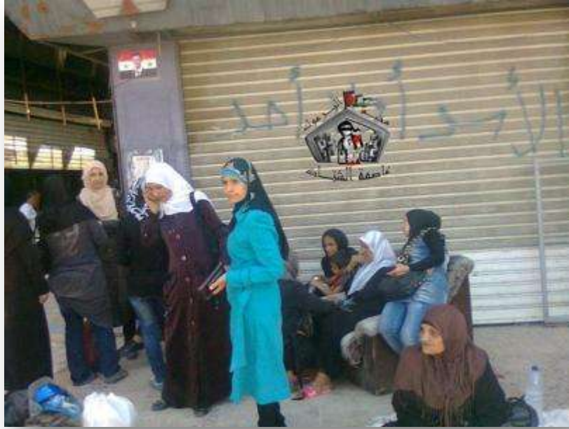
من العائلات التي سمح لها بالعودة لمخيم اليرموك

وعلى صعيد آخر تستمر أزمة مياه الشرب في مخيم خان دنون للاجئين الفلسطينيين بريف دمشق، حيث يعاني الأهالي من صعوبات بتأمين مياه الشرب لعائلاتهم، وذلك بسبب انقطاع التيار الكهربائي والمياه بشكل متناوب، مما أجبرهم على شراء المياه عبر الصهاريج والتي قد يتجاوز ثمنها $10، ويذكر أن المخيم يستقبل المئات من العائلات الفلسطينية التي نزحت عن مخيماتها بسبب الحصار والقصف. وفي ريف دمشق أيضاً يعاني مخيم خان الشيوخ من نقص حاد بالخدمات الصحية والمواد الغذائية وذلك بسبب الانقطاع المتكرر للطرق الواصلة بين المخيم ومركز العاصمة وذلك بسبب الاشتباكات وأعمال القصف المتكررة مما أدى إلى صعوبة وصول المواد الغذائية والطبية إلى المخيم، حيث فقدت العديد من الأصناف من أسواق المخيم وارتفع سعر ما تبقى منها. أما في حمص فقد نظم أطفال مخيم العائدين للاجئين الفلسطينيين، أول أمس، وقفة تضامنية مع أهالي قطاع غزة تنديداً باستمرار العدوان الصهيوني على القطاع منذ أكثر من أسبوعين، وفي سياق متصل نظم أهالي مخيم جرمانا مسيرة تضامنية مع أهلهم في قطاع غزة حيث رفعت الأعلام الفلسطينية واللافتات التي تؤكد على وحدة الدم الفلسطيني.