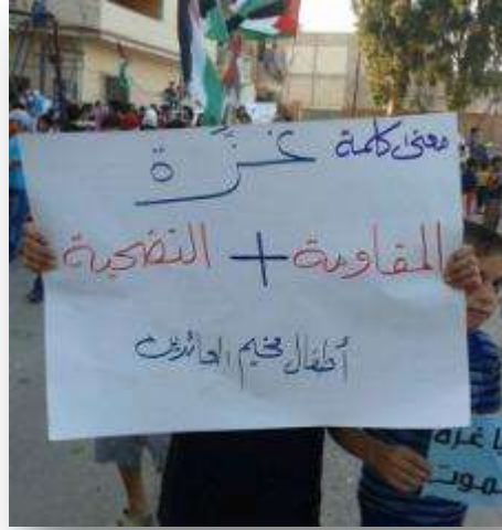
الوقف التضامني مع غزة في مخيم العائدين