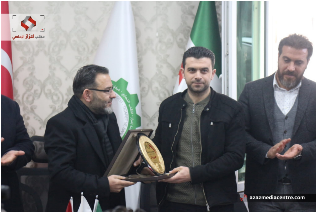
مكتب أعزاز الإعلامي